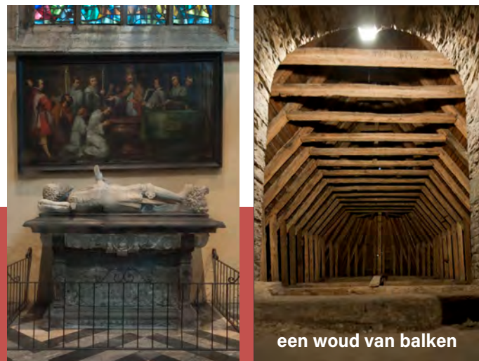
een woud van balken

Tot de meest indrukwekkende delen van het interieur behoren de twee praalgraven achteraan in de zijbeuken. Beide zijn grafmonumenten van baronnen van Pamele.