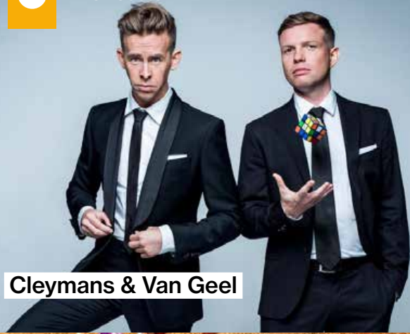
Cleymans & Van Geel