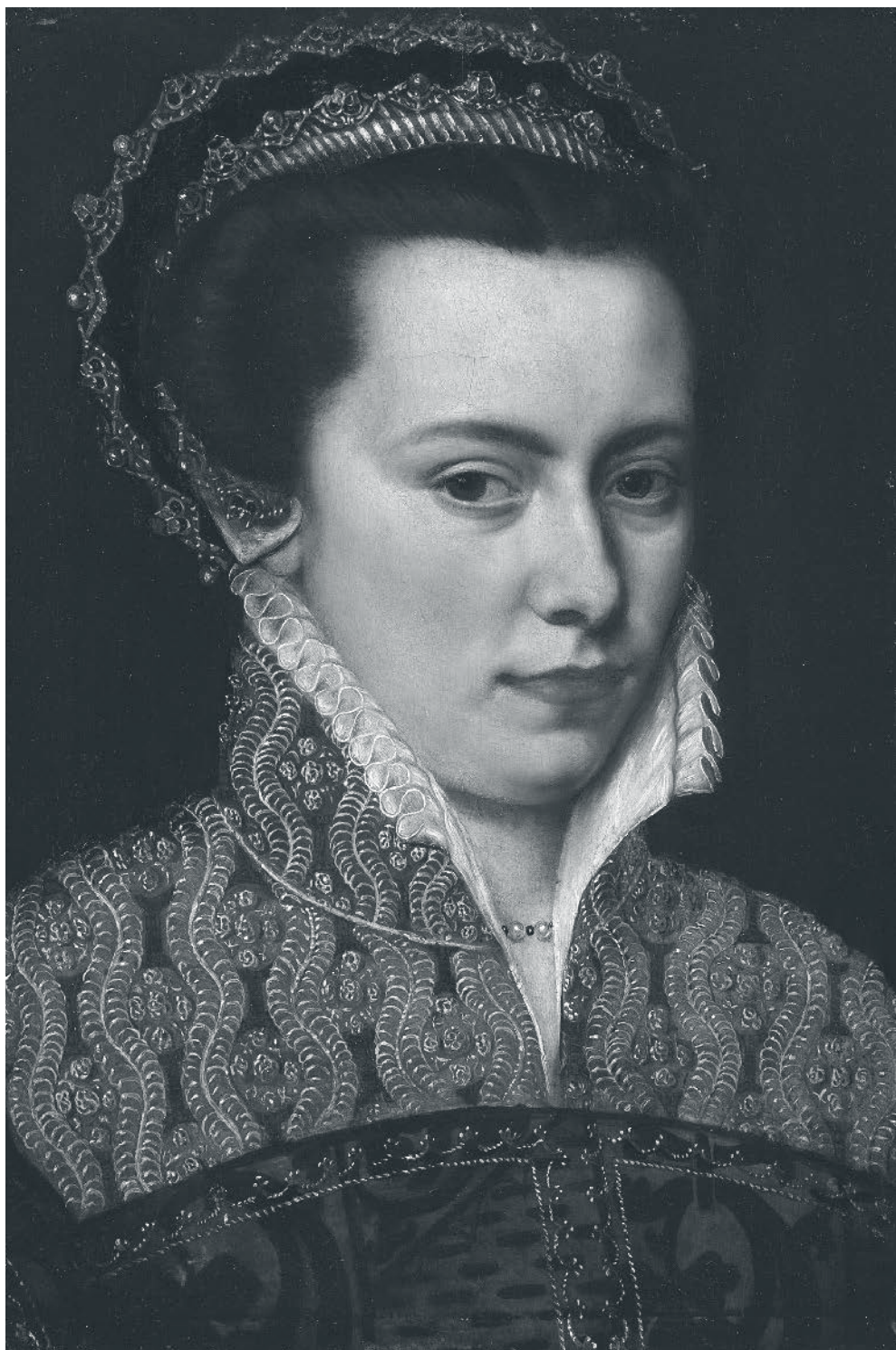
Royal Collection Trust / © His Majesty King Charles III 2024